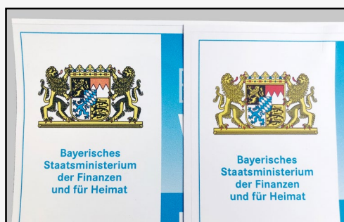
Stattswappen im PDF-Format